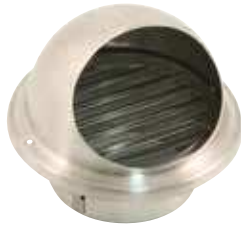
638 - Grilles rondes en applique