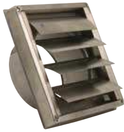
633 - Grilles de hotte en applique