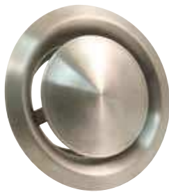
636 - Soupapes d'aspiration réglables en applique