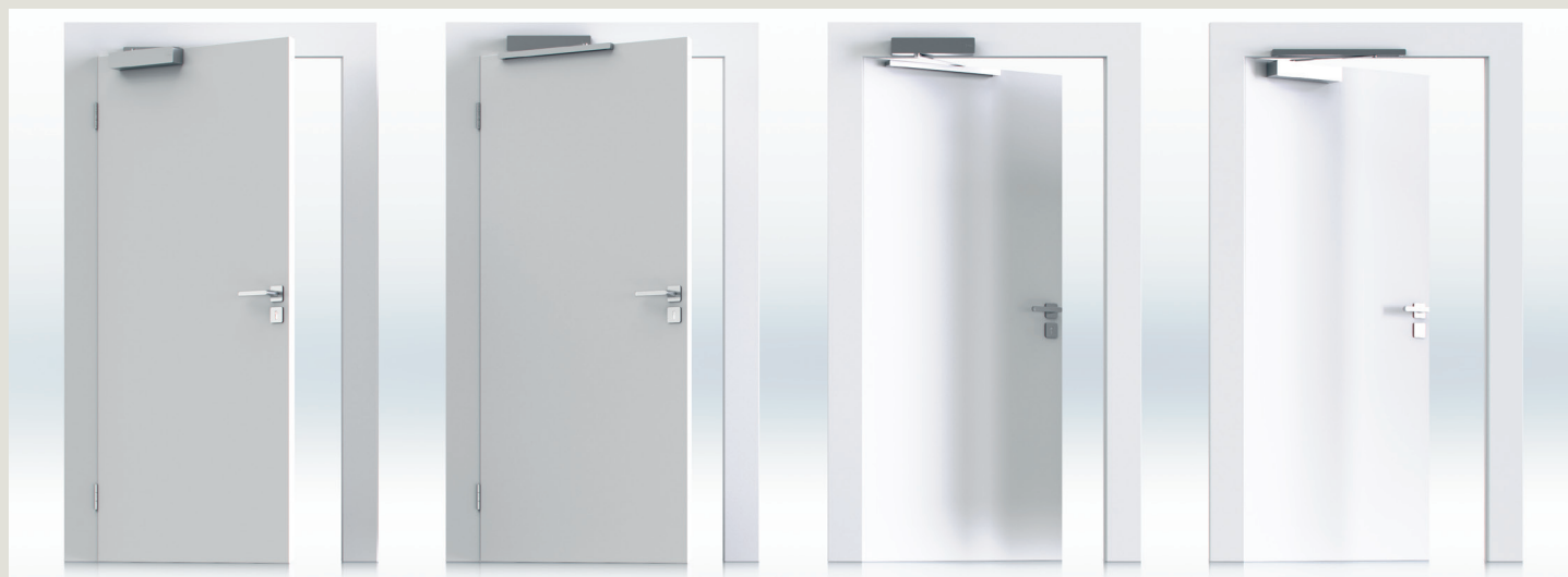
1. Montage sur l'ouvrant côté paumelles